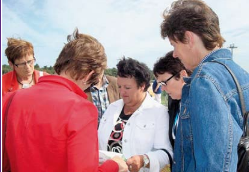
Eerst de route uitstippelen