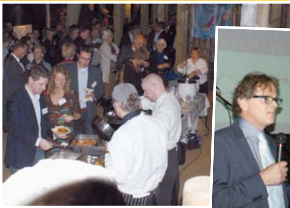
De start van het symposium met een gezond buffet