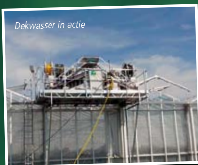
Dekwasser in actie

Loonbedrijf Greenpride uit Klazienaveen heeft door de toenemende vraag het machinepark uitgebreid met twee automatische dekwasininstallaties. Met vijf borstelmachines is Greenpride nu één van de grotere loonwerkers in de Nederlandse glastuinbouw en daarnaast actief in Duitsland, Polen en Oostenrijk. Erwin Hebels, eigenaar van